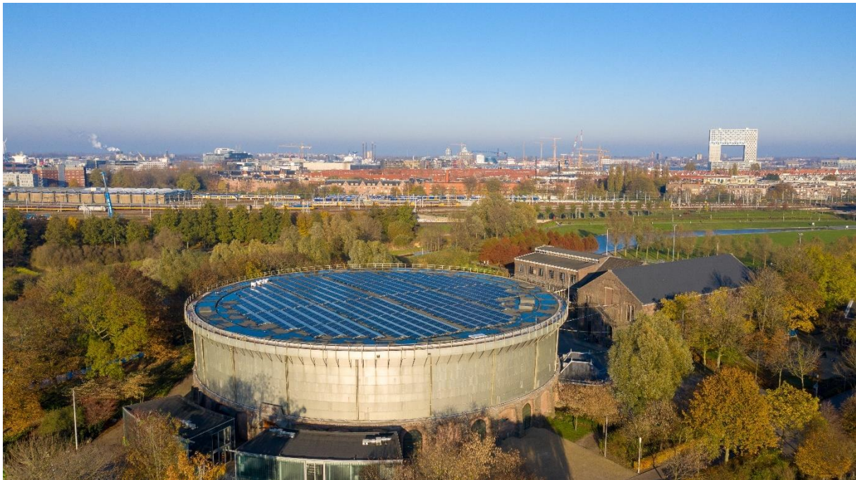
Foto: Westergasfabriek Ecostrroom, 150 Amsterdamse huishoudens die gezamenlijk energie opwekken. De 1024 panelen zijn geplaatst door de Zonnefabriek in de zomer van 2018.