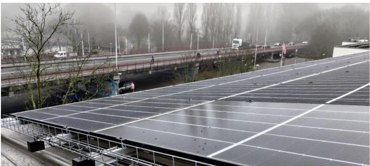
Foto: Flevopark Ecostrroom I. Op het C-Blok van de Zeeburgerdijk zijn 159 panelen geplaatst in 2022. Vanwege de zuidopstelling van het dak levert dit project de grootste opwek per zonnepaneel op van alle Ecostrroomprojecten.