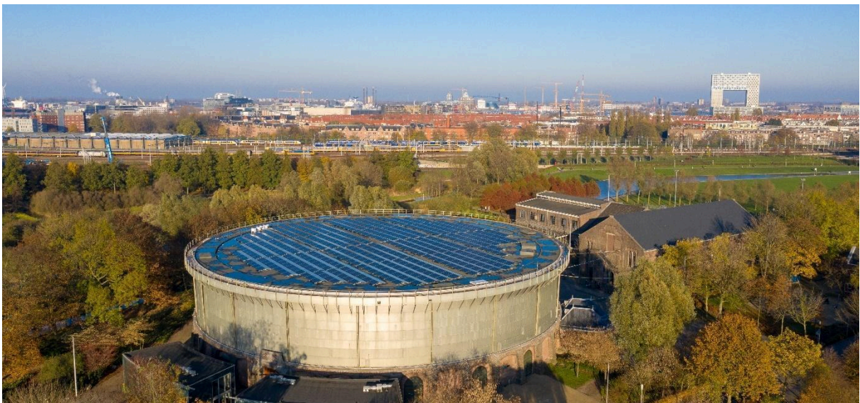
Foto: Westergasfabriek Ecostrroom, 150 Amsterdamse huishoudens die gezamenlijk energie opwekken. De 1024 panelen zijn geplaatst door de Zonnefabriek in de zomer van 2018.